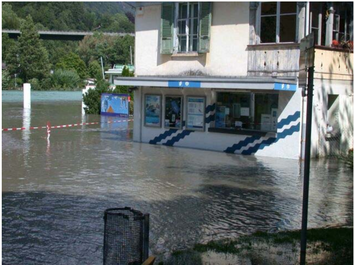
Interlaken Ost, Schiffstation