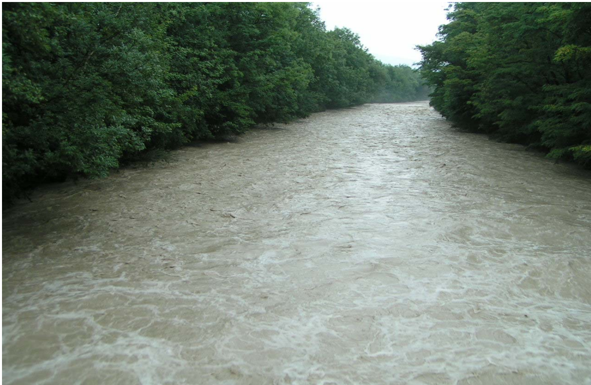
Zulg in Steffisburg

Dramatische und furchterregende Bilder konnten wir uns in letzter Zeit zu Gemüte führen. Nichts schönes. Wir haben überschwemmte Dörfer, mit Schlamm gefüllte Wohnzimmer und zu Amphibienfahrzeugen mutierte Opel gesehen. Und Fische? Wer hat Fische gesehen? Vor lauter Dreckwasser natürlich niemand. Dabei wären sie en masse auf den Feldern, in den Kellern und auf den Autobahnen zu sichten gewesen. Und sind sehr wahrscheinlich auch dort liegen geblieben. Diverse Annäherungsversuche bestärken meine Annahme (u.a. einmal 5 Stunden auf dem Thunersee Umgebung Spiez ohne Rupf, nichts, gar nichts). Hier noch einige Impressionen aus der Region: