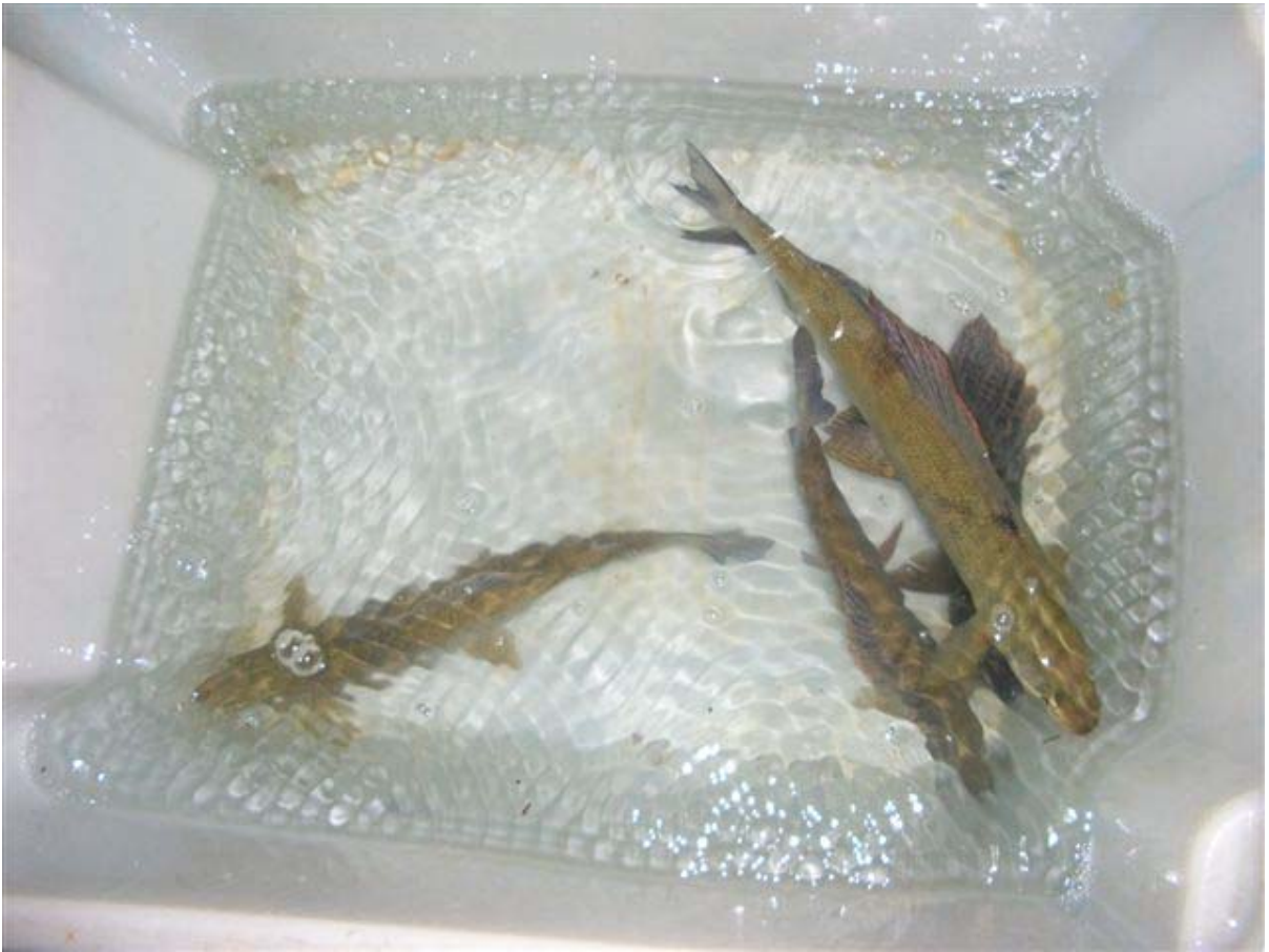
Wassertank auf dem Boot