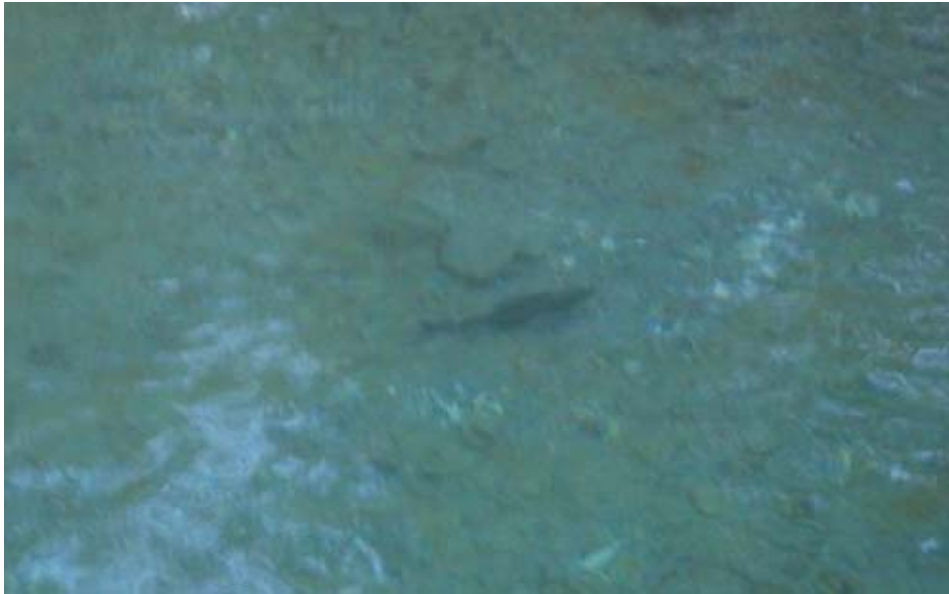
Da schwimmt sie noch im Wasser...

Der einsatzwillige Reporter Nivea Master war für uns wieder vor Ort. DANKE!