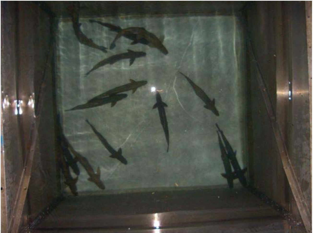
Grosser Tank am Steg mit Männerüberschuss...