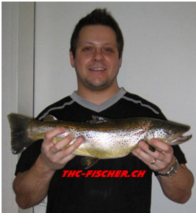
MG überlistet schöne 50er Bachforelle mit dem Wobbler. 1'380 Kg, für ne Frühjahresfario doch beachtlich

Congratulation from the THc-Nation. Seeehr überwältigend.