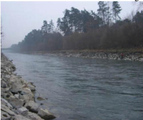
Aarekanal unterhalb Thun