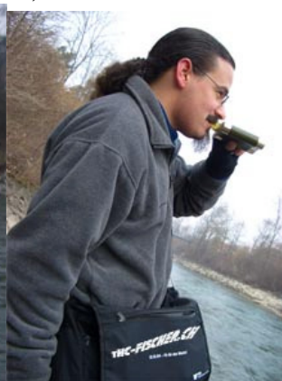
Original Grappa Schomi