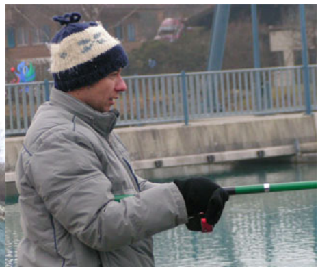
Rookie Domi voll konzentriert