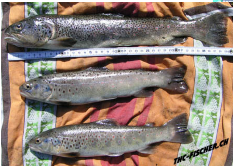
Vätü startet zur Abwechslung mal mit ner Triplette