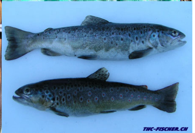
Eisbachforellendoublette von Salmotti